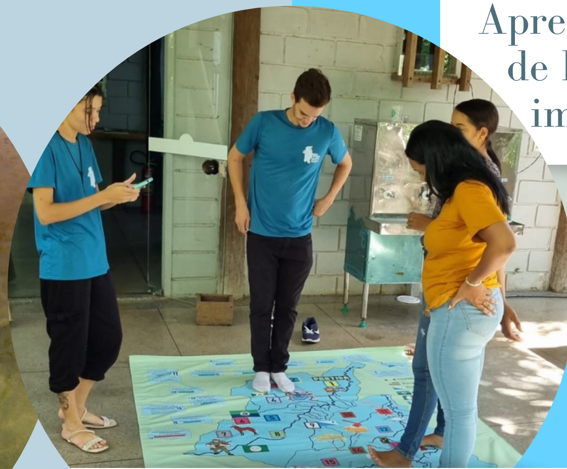
Atividade lúdica: Jogo “conheça sua bacia”