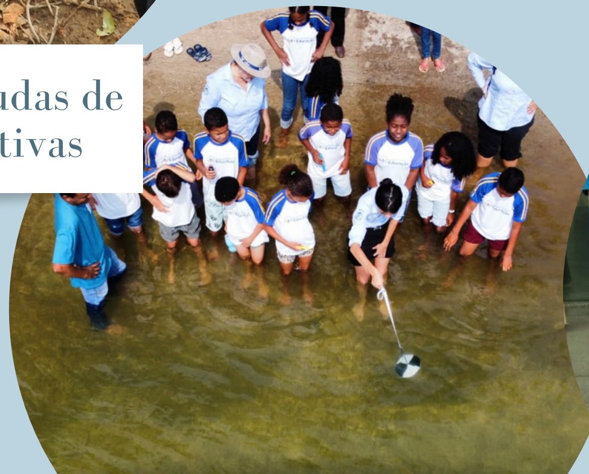
Explicação e atividade lúdica de medição de parâmetros de qualidade da água