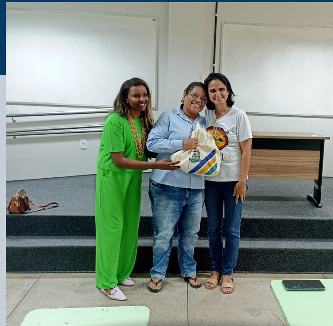
1º lugar PROEX, XII Seminário de Extensão -2023