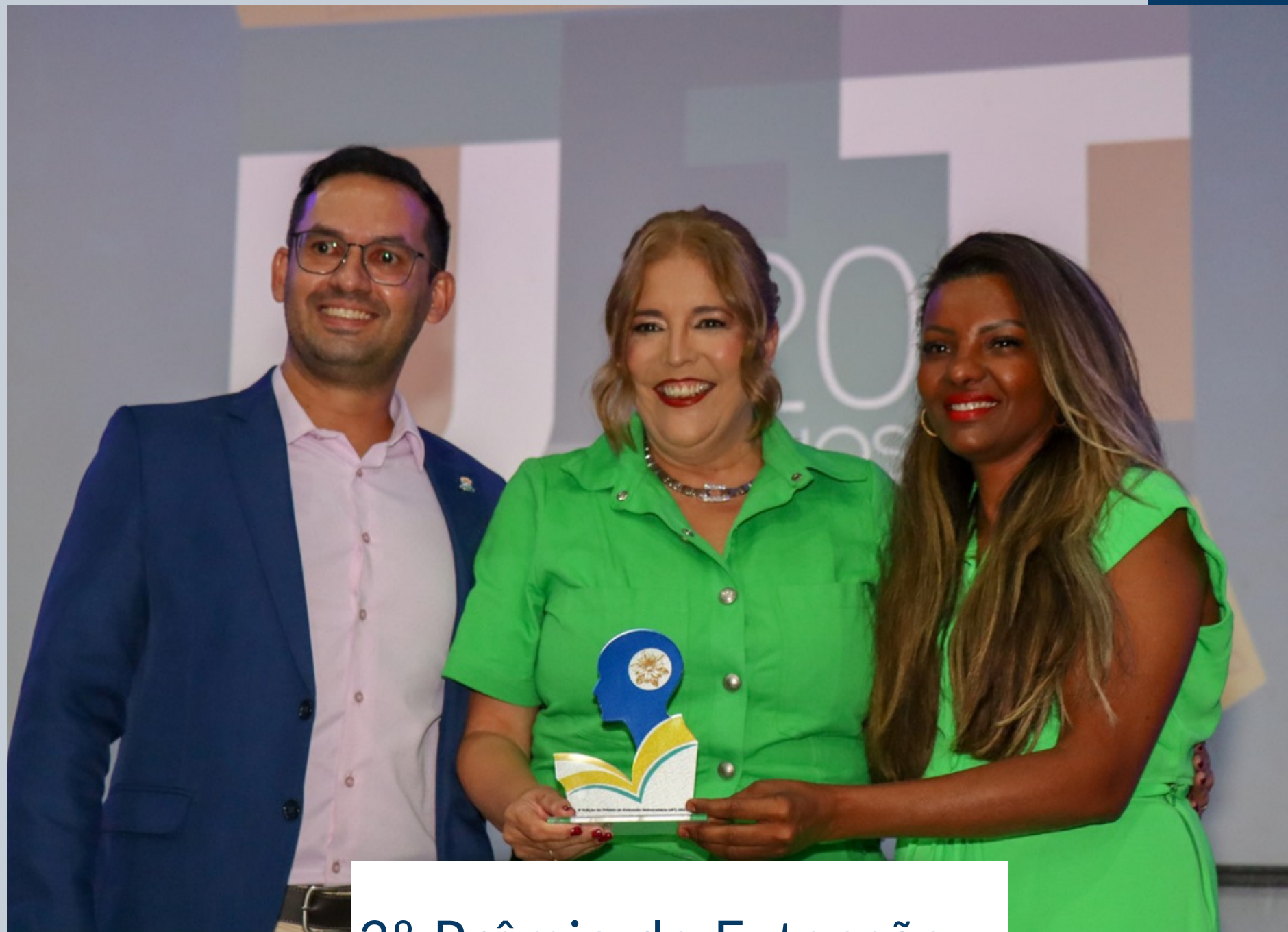
3º Prêmio de Extensão Universitária UFT/2023