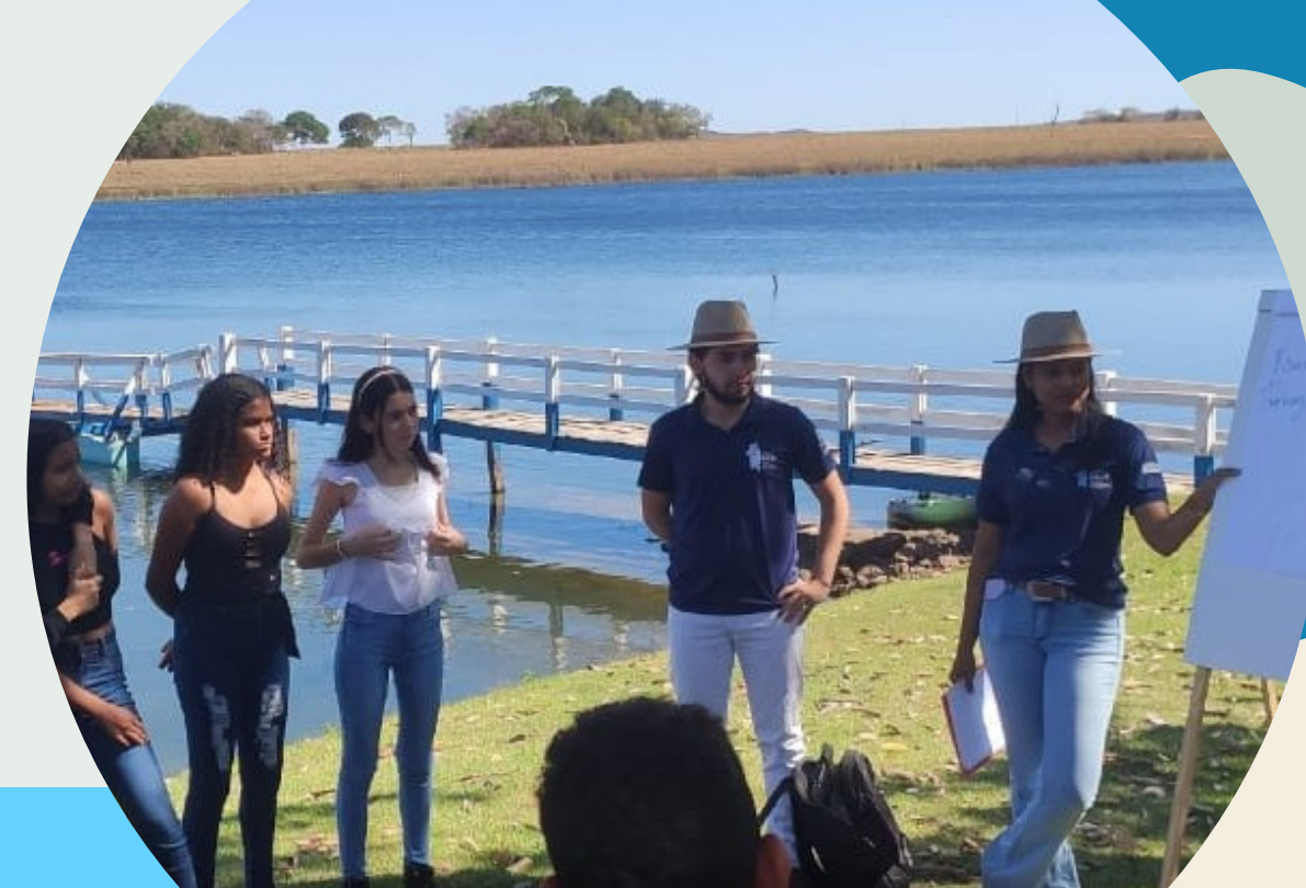
Apresentação de conceitos de bacia hidrográfica e importância da água