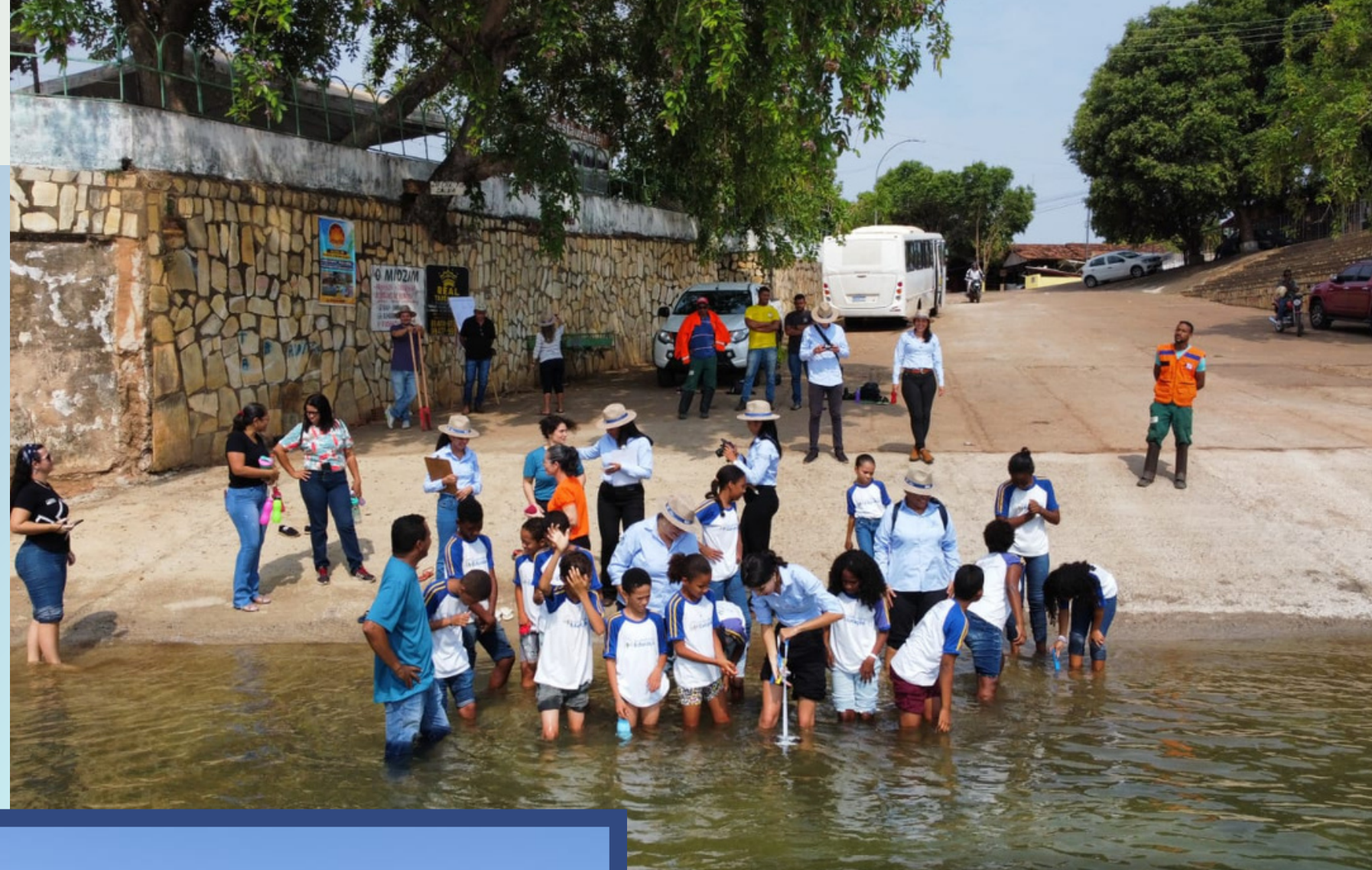
Ação nas margens do rio Tocantins no município de Peixe-TO 29/09/2023