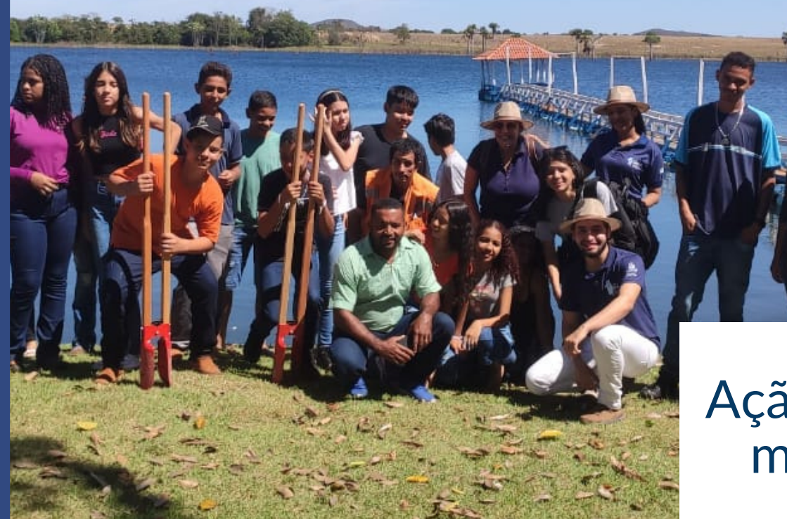
Ação na fazenda “Felicidade” município de Talismã-TO 16/08/2023