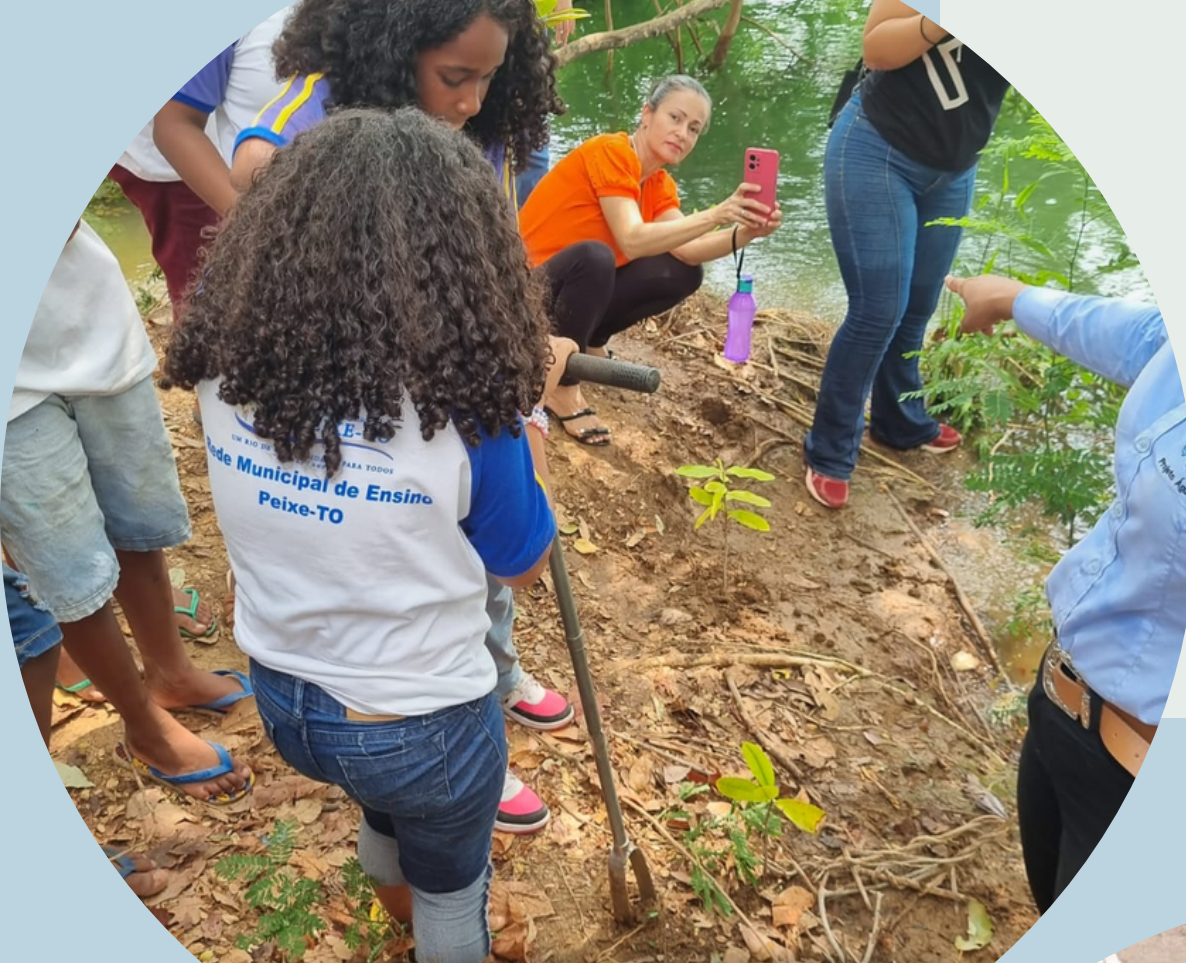
Plantio de mudas de espécies nativas